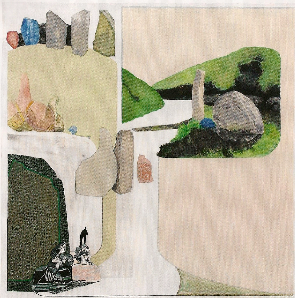
Jo Baer, 'Royal Families (Curves, Points and Little Ones)', 2013